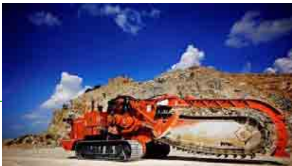
Transher me zingjir