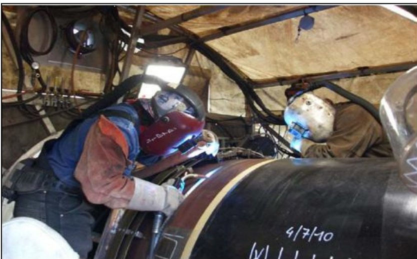
Burimi: ERM SpA (Dhjetor 2011)