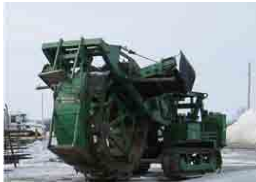
Transher me rrota